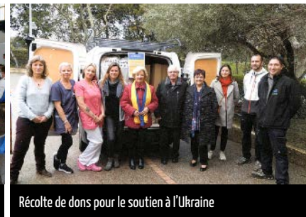
Récolte de dons pour le soutien à l'Ukraine