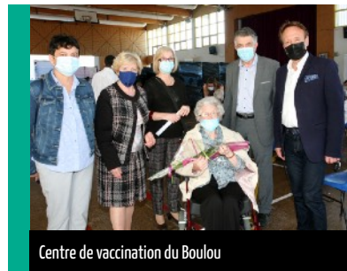
Centre de vaccination du Boulou