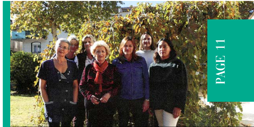
L'équipe dynamique du CCAS